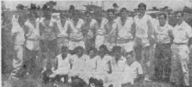
La representación de Puriscal en el campeonato de Liga Nacional ha demostrado a través de sus seis presentaciones ser un 'trabuco' de respeto. Están invictos pero los cuatro empates los han perjudicado en el puntaje. Tienen seis presentaciones para ocho puntos. Ya terminaron sus compromisos en la primera ronda.