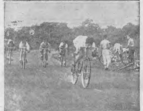
He aquí dos aspectos de las pruebas de pedales celebradas el domingo en la Autopista Presidente Wilson en la última fecha del Torneo Andólores. Los corredores de todas las categorías dieron buenas demostraciones que evidencian su constante superación y sus adelantos en la materia. Gracias al apoyo de sus dinámicos dirigentes y a su inagotable entusiasmo el heroico deporte del ciclismo sigue cumpliendo un gran papel.