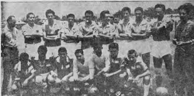
Este es el equipo de Santa Lucia que se encuentra invitado en el Campeonato de Liga Nacional Amateur y que el domingo empató a dos goles con Puriscal. Llevan jugados cinco partidos para nueve puntos. El domingo entrante viajarán a Escazú.